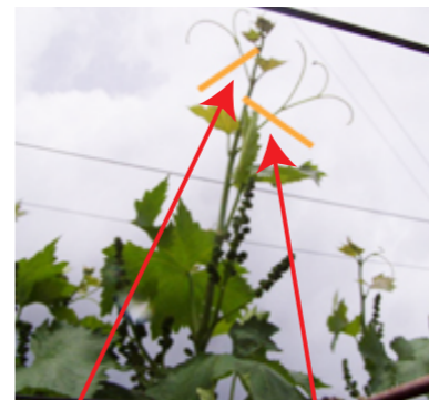
ここで切ります ここでも切ります

巻きつるを切る作業です。つるが成長すると、棚の線や柱、ほかの枝に巻き付いて管理がしにくくなったり、巻き付いたつるが翌年まで残っていると、病気の原因になる可能性があるため切っておきます。